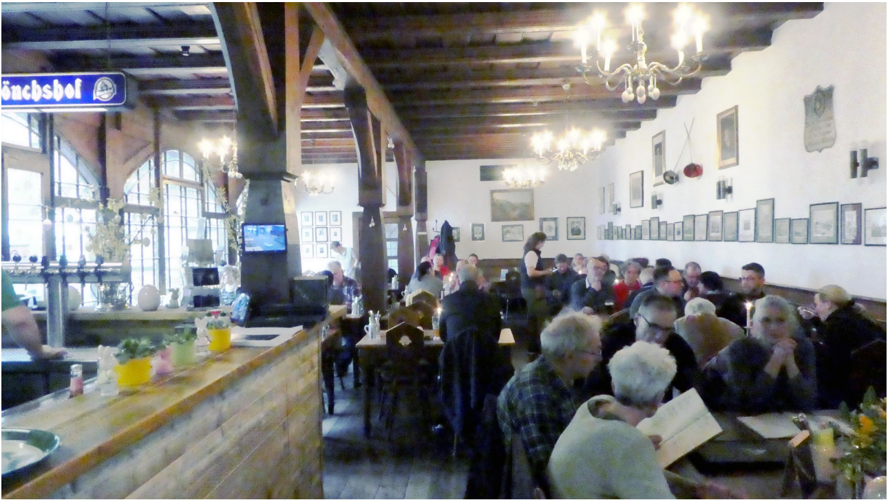
In der Burggaststätte